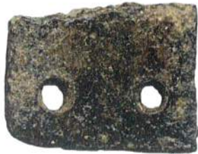
Photographie de la plaque en 2015

Cette plaque issue de Souilhe, a été vue et photographiée en 2015, lors des découvertes de la nécropole de la Mézière. Cette petite plaque rectangulaire cassée, dotée de deux perforations était identifiée sous un n° d'étude 036, n° d'unité stratigraphique S49-3. Cet objet manque en 2021.