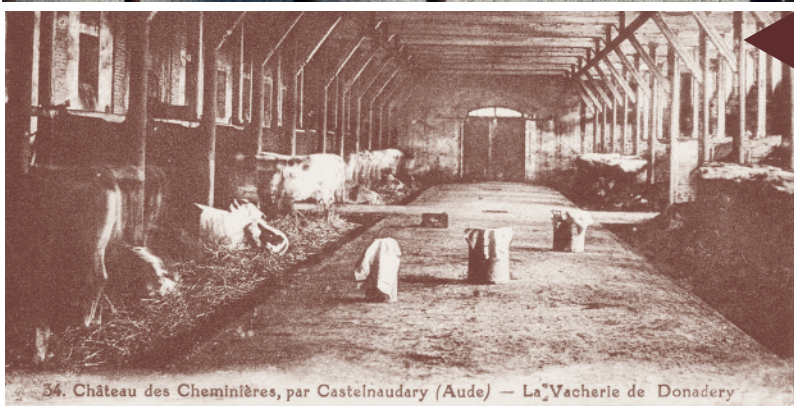
34. Château des Cheminières, par Castelnaudary (Aude) — La Vacherie de Donadery