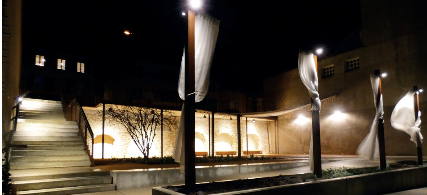
Le belvédère des Lavandières de nuit

Chauriens : Citoyenneté, démocratie, Partage