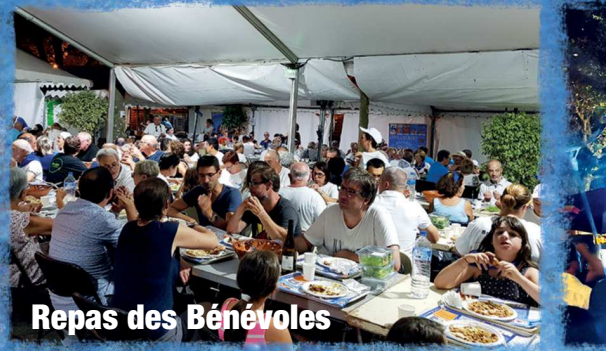
Repas des Bénévoles