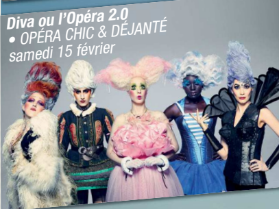
Diva ou l'Opéra 2.0 • OPÉRA CHIC & DÉJANTÉ samedi 15 février