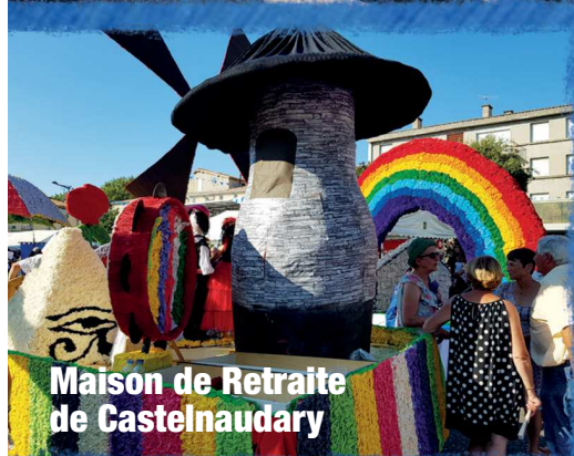
Maison de Retraite de Castelnaudary