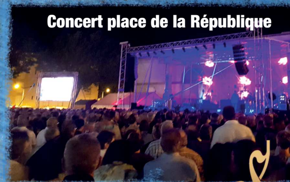
Concert place de la République