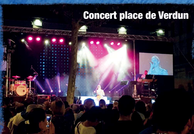
Concert place de Verdun