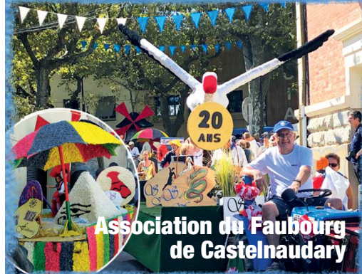
Association du Faubourg de Castelnaudary