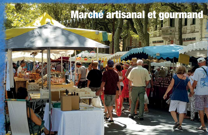
Marché artisanal et gourmand