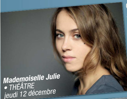
Mademoiselle Julie • THÉÂTRE jeudi 12 décembre

Concert, cirque, théâtre, musique, opéra et danse, il y a pour cette saison, de quoi faire le plein d'émotions et ce, des plus petits aux plus grands !