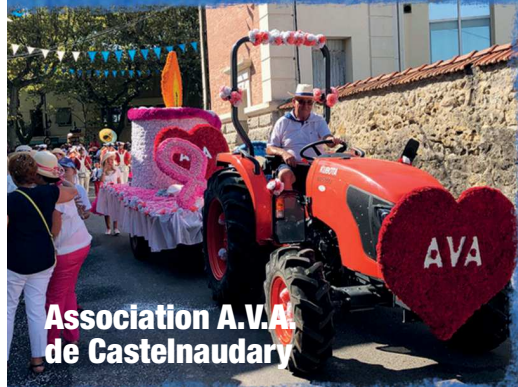
Association A.V.A. de Castelnaudary