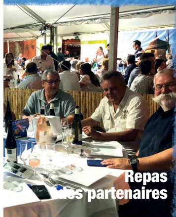
Repas des partenaires