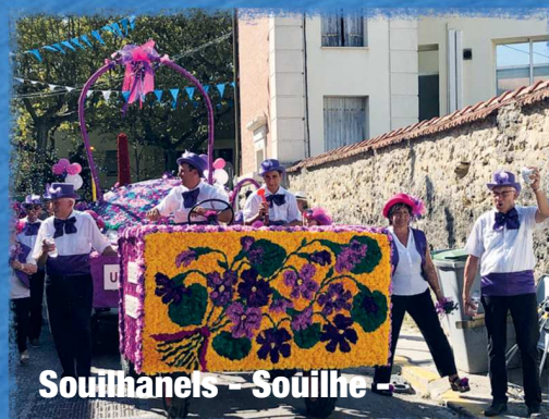
Souilhans - Souilhe -