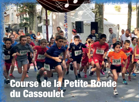
Course de la Petite Ronde du Cassoulet