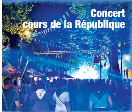
Concert cours de la République