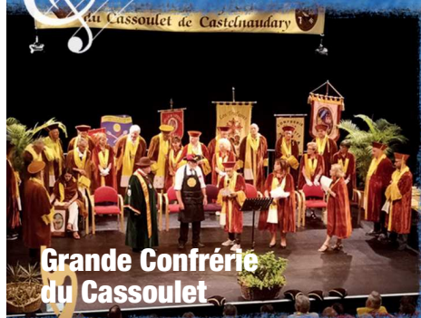
Grande Confrérie du Cassoulet

Réussir une telle fête, c'est comme réussir... un Cassoulet !