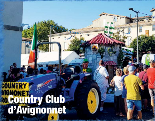
Country Club d'Avignonnet