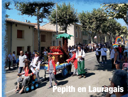
Pepith en Lauragais