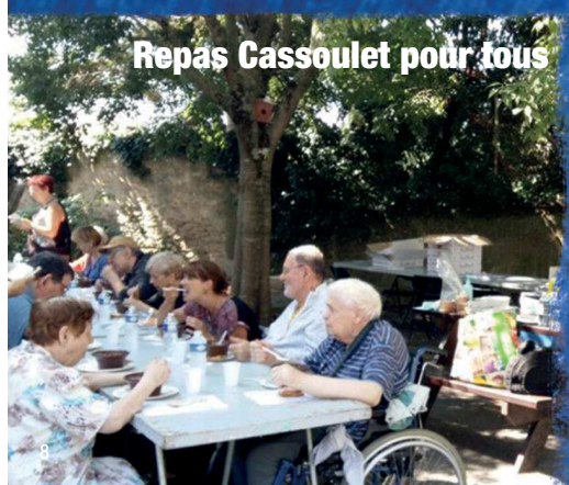
Repas Cassoulet pour tous