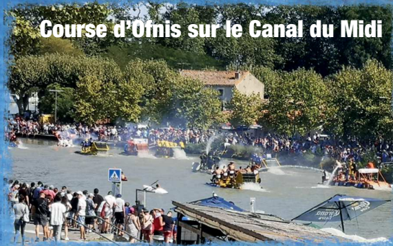
Course d'ornis sur le Canal du Midi