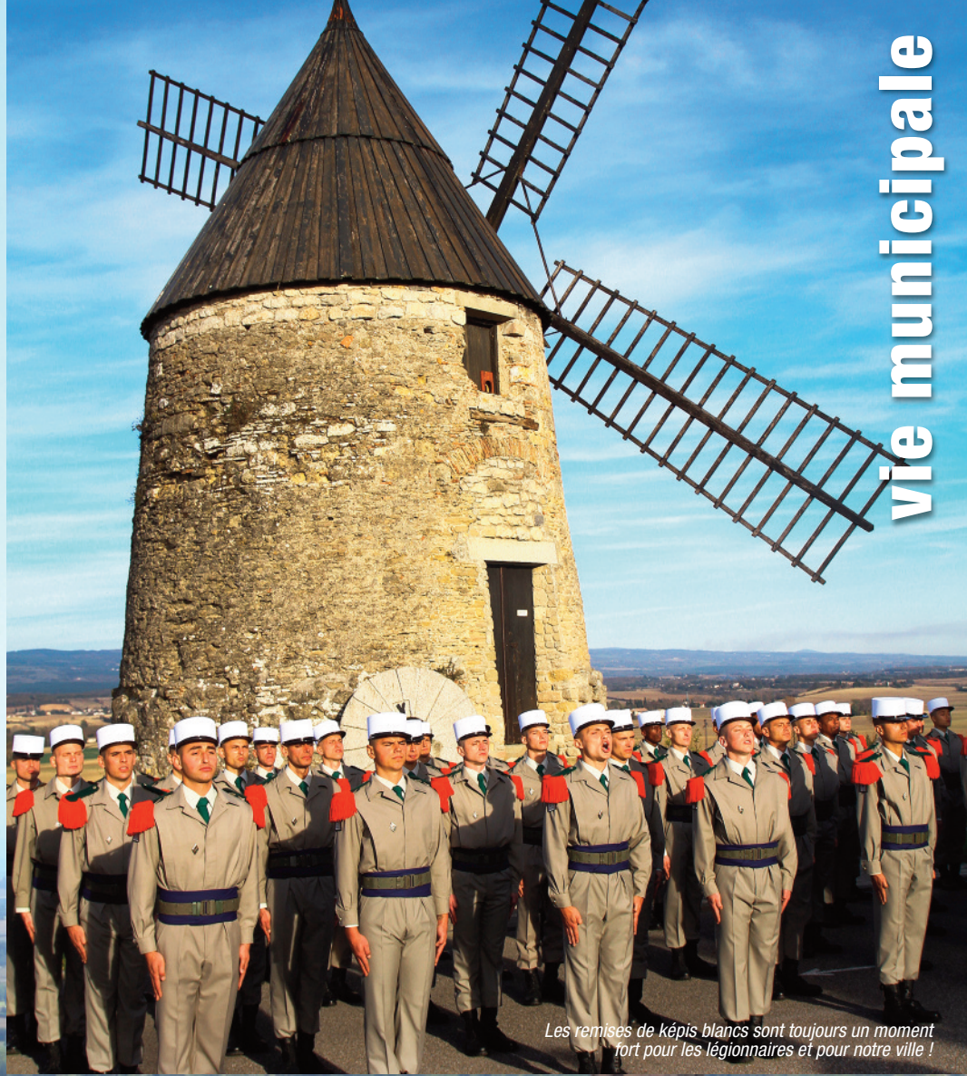
Les remises de képis blancs sont toujours un moment fort pour les légionnaires et pour notre ville !

Retrouvez toute l'actualité municipale sur www.ville-castelnaudary.fr