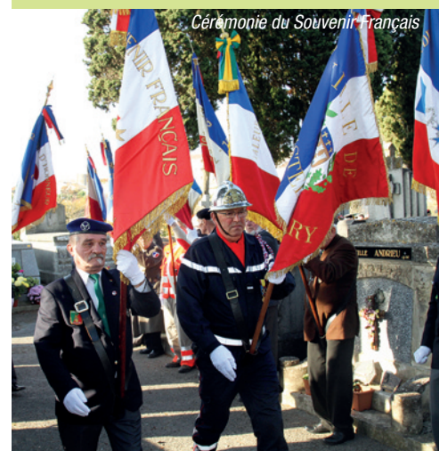
Cérémonie du Souvenir Français