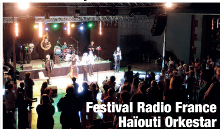
Festival Radio France Haïouti Orkestar