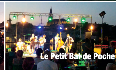
Le Petit Bar de Poche

C'est dans notre ville que Sophie KOCH s'est produite, accompagnée au piano par Pierre RÉACH. Pour sa première prestation sur une scène audoise, cette prodigieuse artiste connue mondialement et habituée des plus grandes scènes lyriques : Paris, Vienne, Milan, New-York... a répondu à l'invitation de l'association «Piano à Castelnaudary». Un éclat supplémentaire pour cet événement incontournable qui réunit de plus en plus de passionnés de la grande musique.