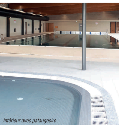
Intérieur avec pataugeoire

Historique/ Construite en 1968, la piscine de Castelnaudary se composait de trois bassins : un bassin olympique extérieur de 6 couloirs, un bassin de 25 mètres et une pataugeoire extérieure. Alors qu'elle ne fonctionnait que durant l'été, en 1973, la Mairie a décidé de couvrir le bassin de 25 mètres, afin que les habitants puissent bénéficier de l'équipement toute l'année. Au début des années 2000, les élus ont étudié un nouveau projet pour anticiper le vieillissement des installations et accueillir dans des conditions optimales près 60 000 personnes par an.