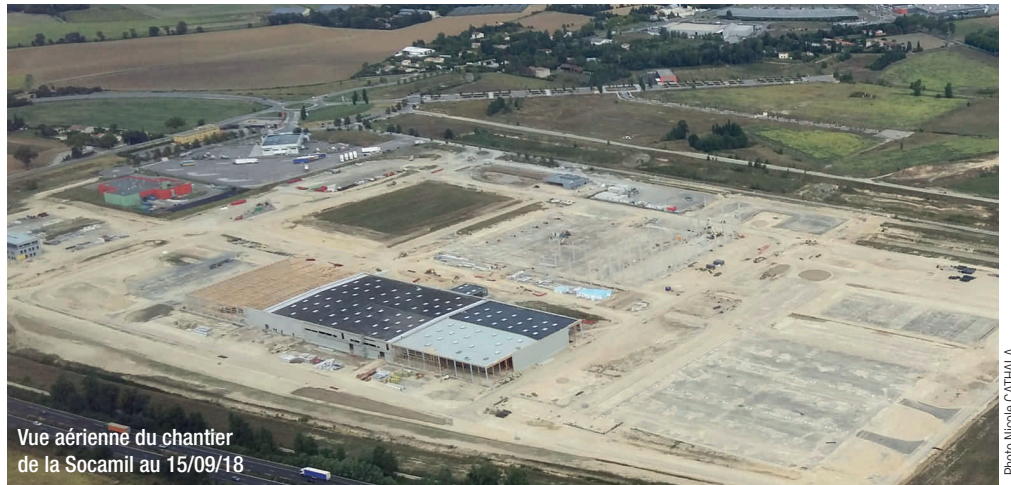
Vue aérienne du chantier de la Socamil au 15/09/18