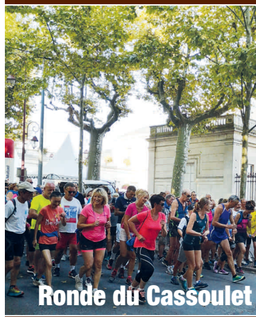
Ronde du Cassoulet