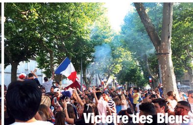
Victoire des Bleus