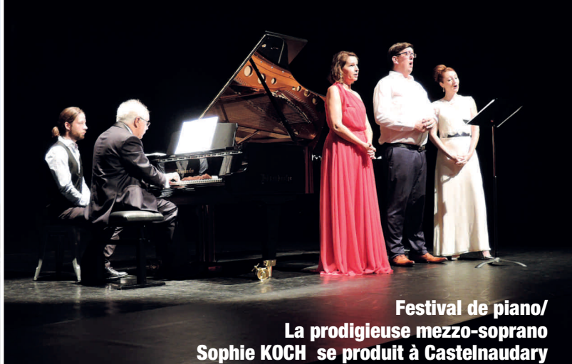
Festival de piano/ La prodigieuse mezzo-soprano Sophie KOCH se produit à Castelnaudary