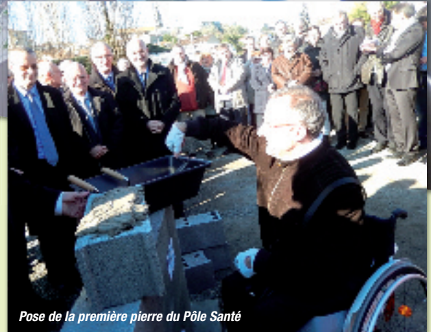
Pose de la première pierre du Pôle Santé

La pose de la première pierre marque le début de la réalisation d'un chantier de grande ampleur.