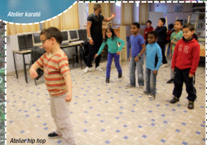
Atelier hip hop

L'Éducation Nationale a pu former 12 enseignants et la ville a équipé leur salle de classe en priorité. Dans les prochains jours, Castelnaudary deviendra «Ville pilote de l'ENT» pour l'école élémentaire au niveau académique.