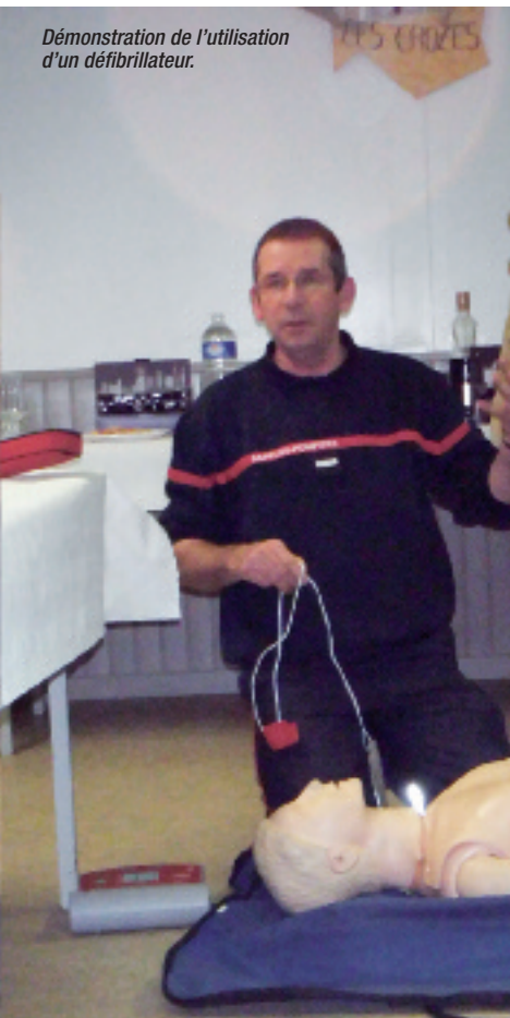
Démonstration de l'utilisation d'un défibrillateur.