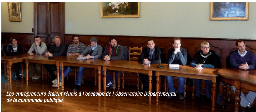
Les entrepreneurs étaient réunis à l'occasion de l'Observatoire Départemental de la commande publique.

De nombreux entrepreneurs se sont intéressés à ce rendez-vous qui a permis d'expliquer les modalités de la commande publique. Les collectivités territoriales représentent une part importante de l'offre dans ce domaine. Si le critère de prix reste déterminant, il a été rappelé aux participants que l'attention était également portée sur la qualité des réalisations et le respect des critères sociaux.