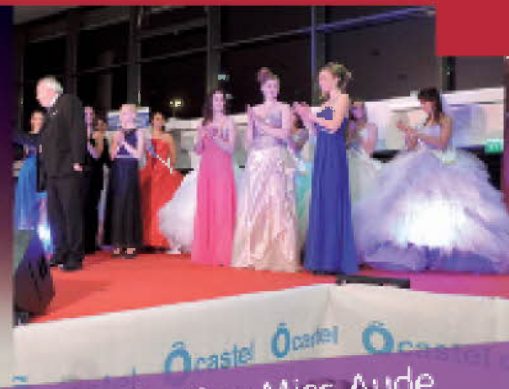
Election Miss Aude