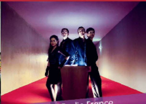
Festival Radio France