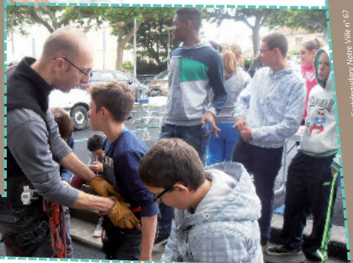
Castelnaudary Notre Ville n° 67

Rentrée scolaire : pour vous renseigner sur la rentrée scolaire 2014/2015, contacter le service des Affaires Scolaires au 04 68 94 58 36 ou se rendre sur www.ville-castelnaudary.fr rubrique vivre à Castel/scolarité/écoles