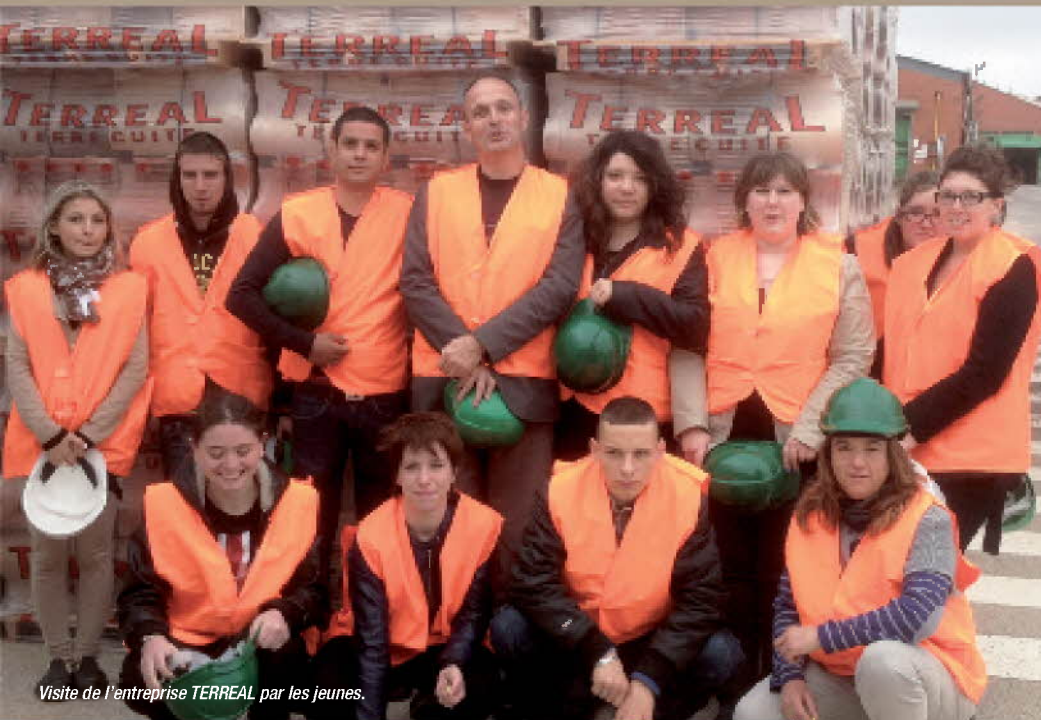
Visite de l'entreprise TERREAL par les jeunes.

La Mission Locale Jeunes de Castelnaudary met en œuvre la «Garantie Jeunes», un dispositif d'accompagnement des jeunes vers l'emploi et l'autonomie, leur garantissant un seuil de ressources équivalent au montant du RSA.