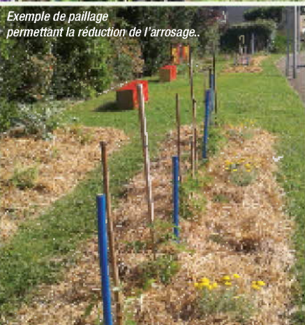
Exemple de paillage permettant la réduction de l'arrosage.

Aussi esthétique qu'original, il permet de faire découvrir aux enfants la saisonnalité, les senteurs nouvelles (plantes à curry, différentes menthes...) mais également les techniques de jardinage, comme le paillage qui réduit fortement le recours à l'arrosage.