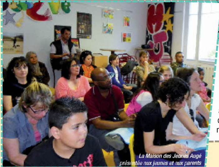
La Maison des Jeunes Augé présentée aux jeunes et aux parents

C'est à l'initiative de la Ville, qui dispose d'éducateurs formés et expérimentés, que sont mises en place toute l'année des actions de prévention envers les jeunes. A l'approche de l'été et de la fin des cours, des activités gratuites et encadrées ont été proposées aux jeunes sur différents sites de la ville. Ce travail de proximité a fait la preuve de son efficacité. Il est donc reconduit chaque année et son dispositif amélioré.