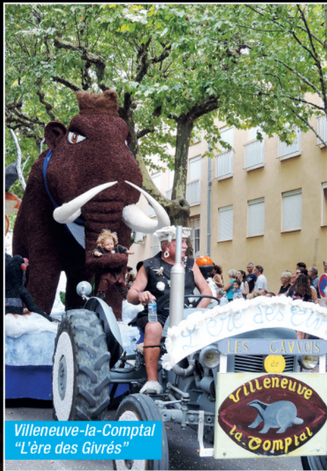
Villeneuve-la-Comptal "L'ère des Givrés"