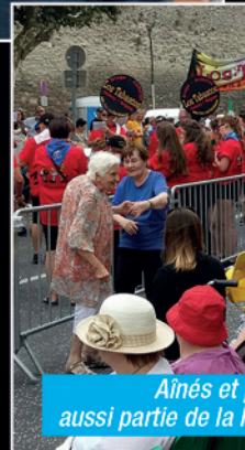
Aînés et aussi partie de la