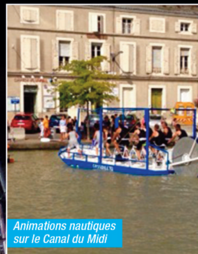
Animations nautiques sur le Canal du Midi