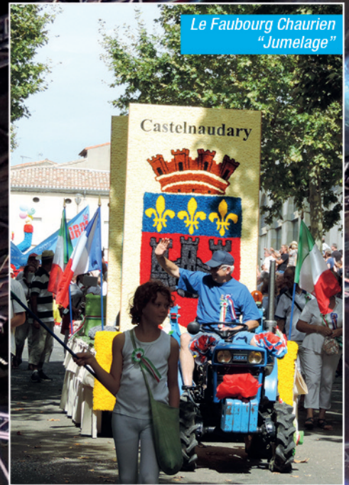
Le Faubourg Chaurien "Jumelage"