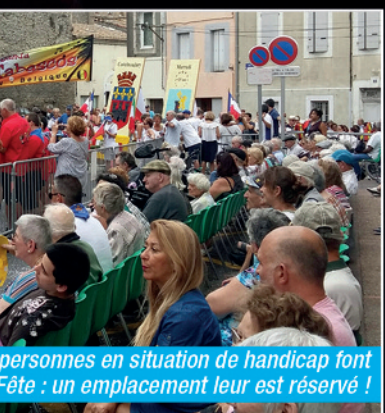
Personnes en situation de handicap font Fête : un emplacement leur est réservé !