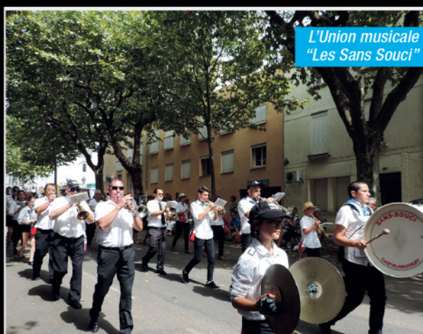
L'Union musicale "Les Sans Souci"