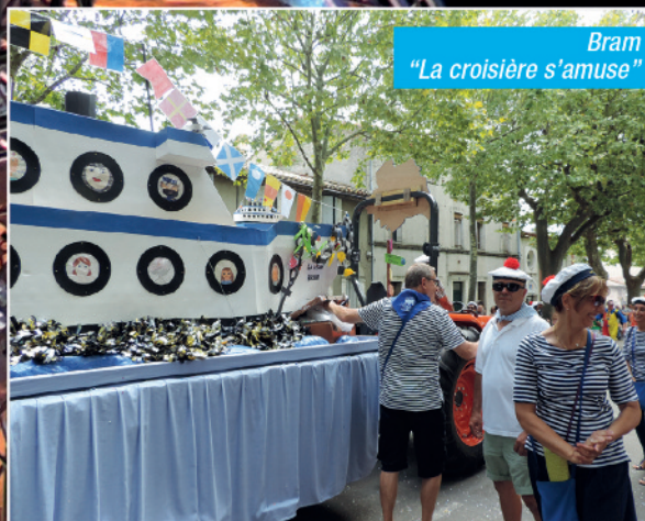
Bram "La croisière s'amuse"