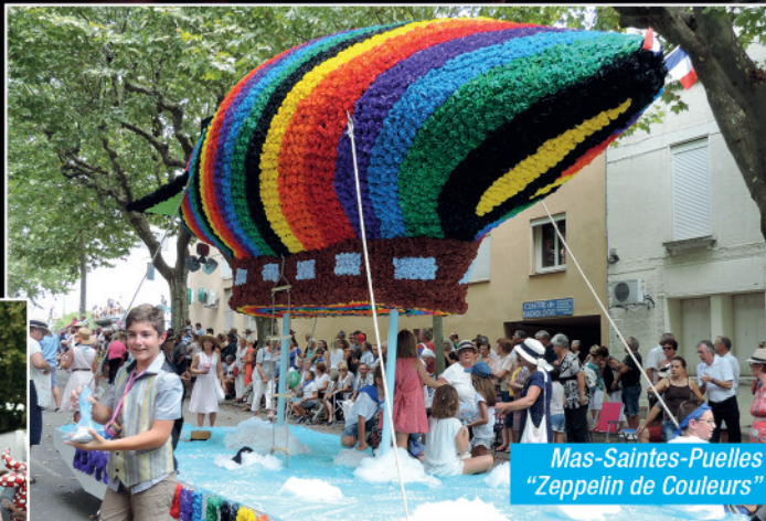
Mas-Saintes-Puelles "Zeppelin de Couleurs"