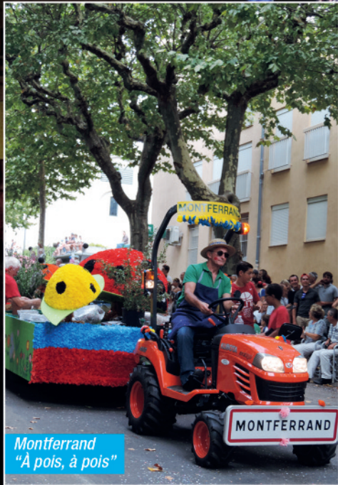
Montferrand "À pois, à pois"