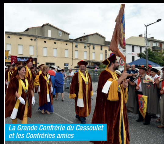
La Grande Confrérie du Cassoulet et les Confréries amies