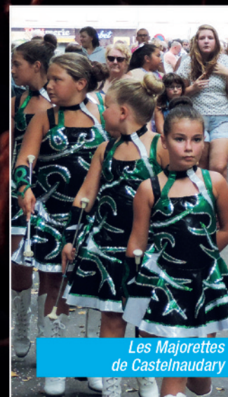
Les Majorettes de Castelnaudary

C'est le rendez-vous festif chaurien le plus attendu de l'année !