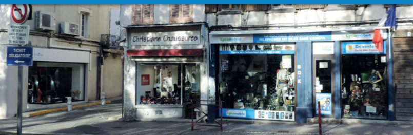
L'îlot Pasteur, un projet qui s'inscrit dans cette démarche

Autant d'axes de travail pour favoriser le bien vivre en centre-bourg.