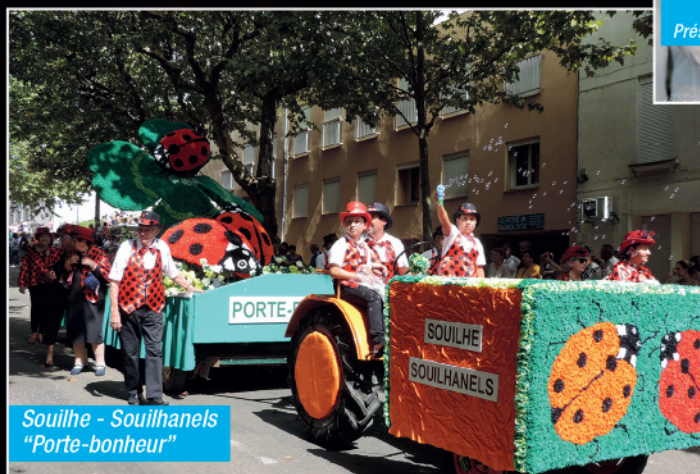
Souilhe - Souilhanel "Porte-bonheur"