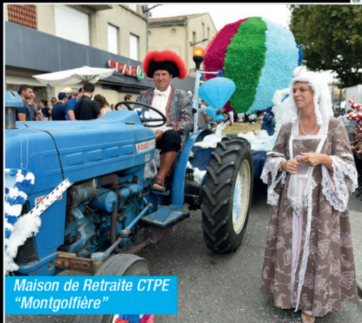
Maison de Retraite CTPE "Montgolfière"