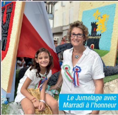
Le Jumelage avec Marradi à l'honneur