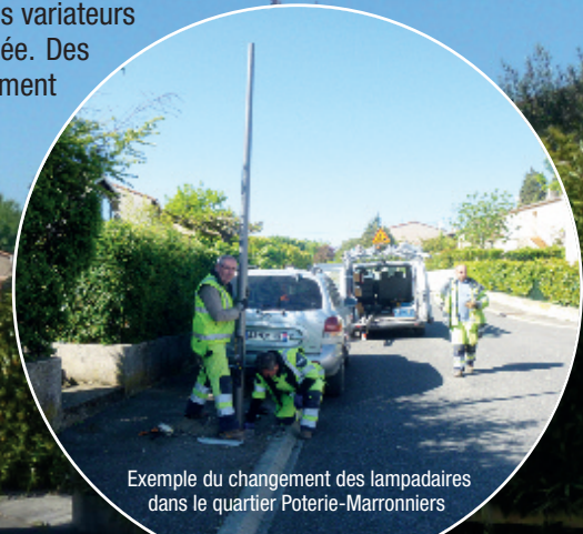
Exemple du changement des lampadaires dans le quartier Poterie-Marronniers