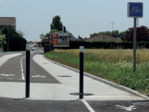
Avenue du Docteur Guilhem