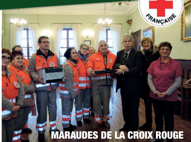
MARAUDES DE LA CROIX ROUGE

L'École de musique et les Sans Souci ont déjà annoncé leur engagement pour ce Téléthon, ainsi que les coiffeuses, les Cyclos du Lauragais, le Lion's Club et encore de nombreux autres bénévoles.