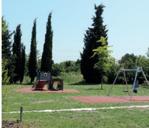
Quartier des Marronniers