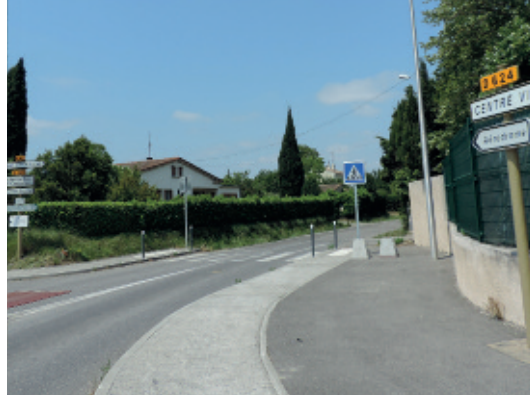
Avenue du Docteur Laënnec