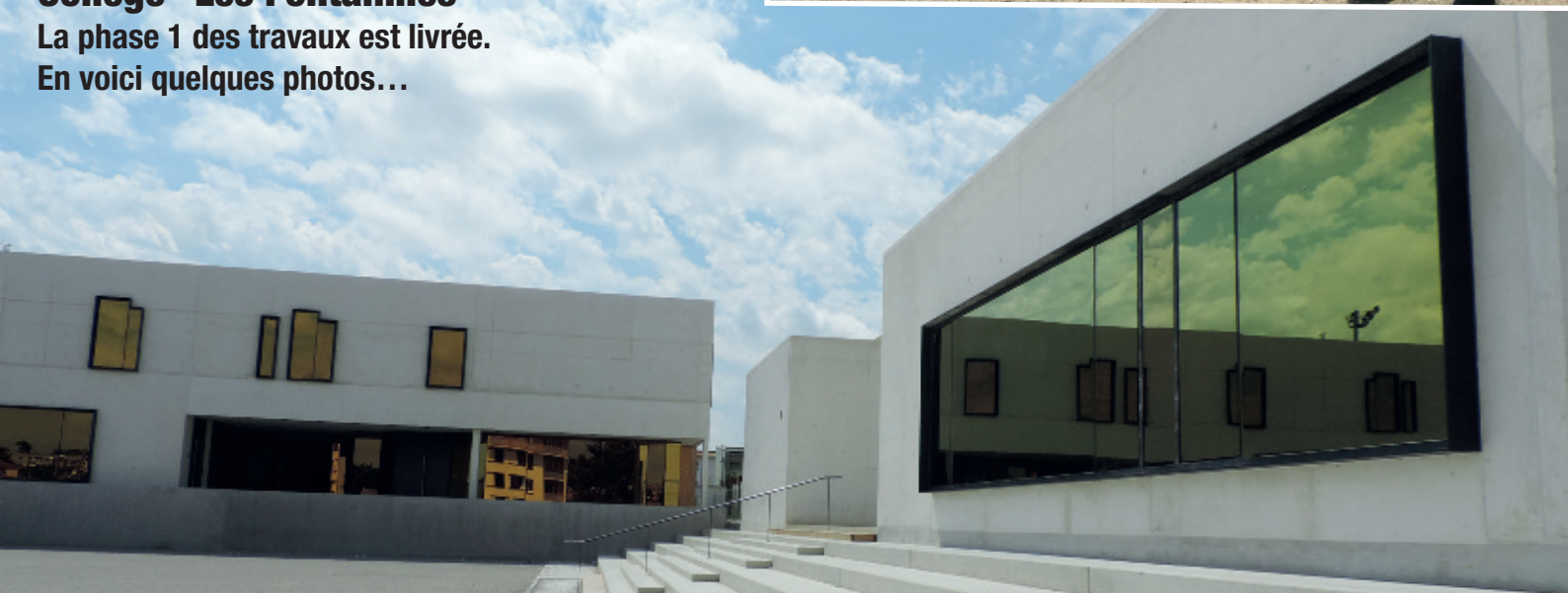
LE RESTAURANT SCOLAIRE