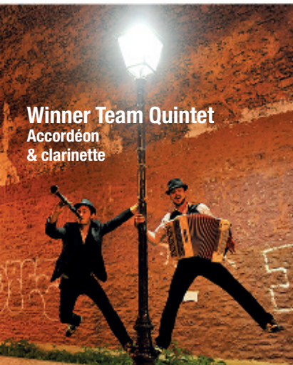
Winner Team Quintet Accordéon & clarinette

Cette année le festival s'étend et s'ancre dans sa nouvelle grande région d'Occitanie ! Il offrira à Castelnaudary trois concerts GRATUITS de qualité exceptionnelle.