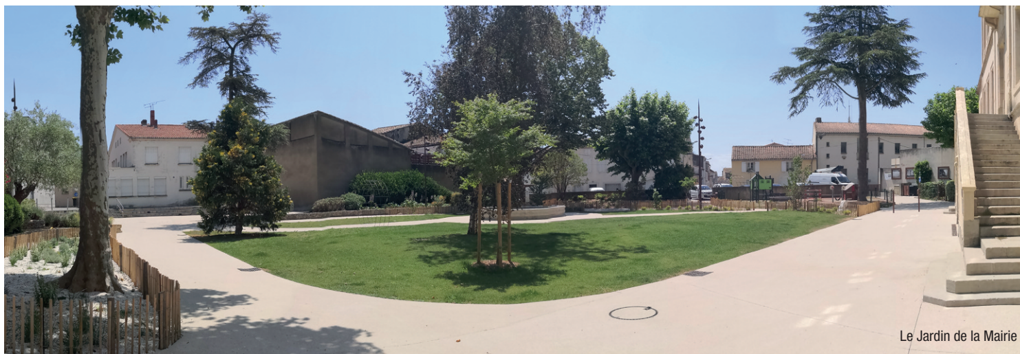
Le Jardin de la Mairie

Chauriens : Citoyenneté, Démocratie, Partage