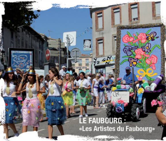
LE FAUBOURG : «Les Artistes du Faubourg»