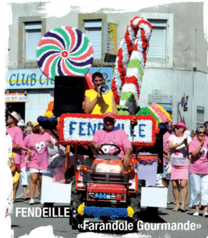
FENDEILLE : «Farandole Gourmande»