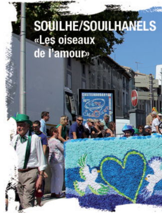
SOUILHE/SOUILHANELS «Les oiseaux de l'amour»