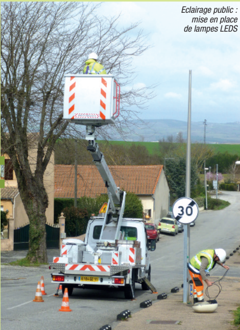
Eclairage public : mise en place de lampes LEDs

Afin de mener à bien sa démarche environnementale, la Ville de Castelnaudary a créé un service développement durable. En place depuis le 1 er février 2015, il regroupe les activités Eau, Energie et Environnement.