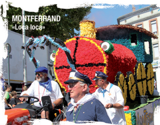
MONTFERRAND «Loca loca»