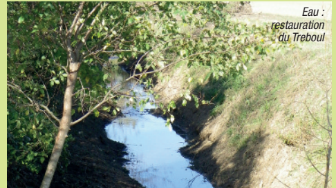
Eau : restauration du Trebol