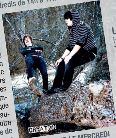
À DÉCOUVRIR LE MERCREDI 4 NOVEMBRE À 20H30 Tout public à partir de 15 ans