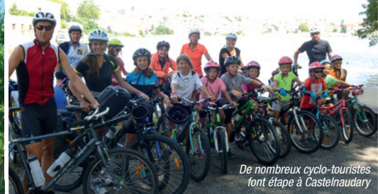
De nombreux cyclo-touristes font étape à Castelnaudary