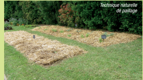
Technique naturelle de paillage

Rappelons que la ville organise le 8 octobre, à la Halle aux Grains, le Forum de l'Habitat "Cœur de Ville", dont l'un des volets d'étude sera la sensibilisation au développement durable.