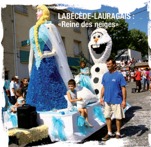
LABÈCÈDE-LAURAGAIS : «Reine des neiges»